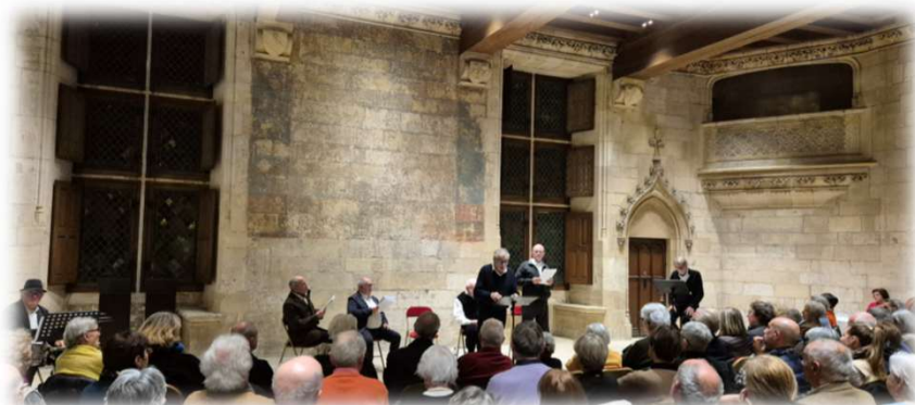
Palais Jacques Cœur à Bourges