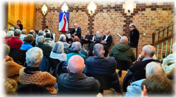
Salle Communale à St Palais